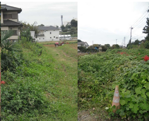
農道・水路の草刈り前