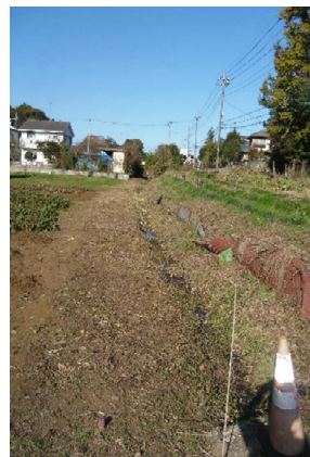
農道・水路の草刈り後