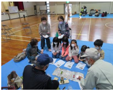
ブンブンゴマ。わくわくしちゃうね。名人のお話よく聴いて。