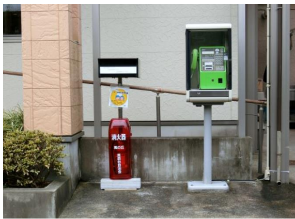
横手原公園（左）と風の丘に新しく設置された消火器