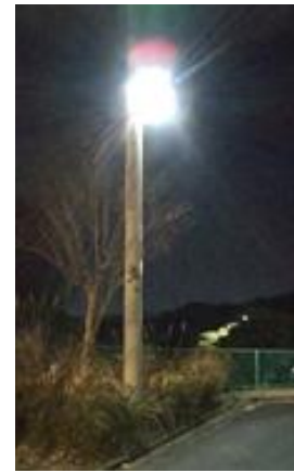
【鳴瀬公園上の三角地帯の電柱】

3月と4月は児童館のお休みが多いですので、事前に閉館日を確認のうえ、ご活用をお願いします。