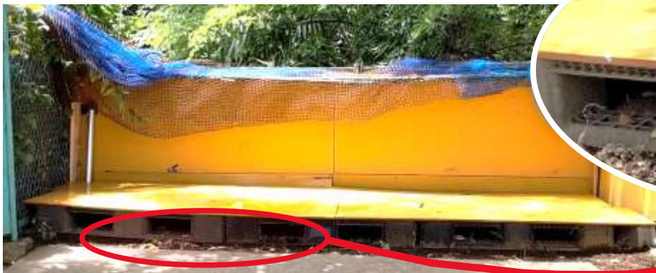
笠張公園ゴミ集積所 改修