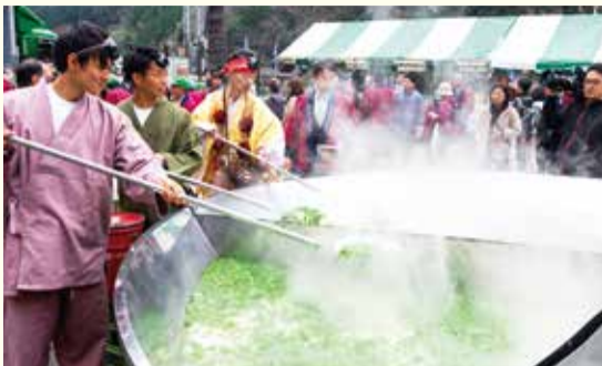
平成31(2019)年 第29回大山とうふまつりの様子

市営大山第二駐車場は3月16日(木)午後5時~19日(日)午後8時まで使用できません。まつり開催中は大山小学校が臨時駐車場となり、会場までのシャトルバス(大人100円、子ども50円)を午前9時から運行します。