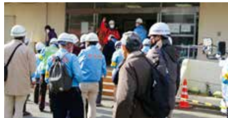
住民避難行動訓練

1月22日、伊勢原中学校をメイン会場とする市内7カ所で、総合防災訓練が行われ、950人が参加しました。都心南部を震源とする最大震度6強の首都直下型地震を想定し、伊勢原南地区の自主防災会や災害時協定を結んでいる関係機関などが参加し、防災行動や連携体制などの確認をしました。