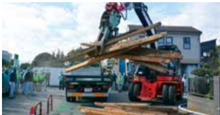
道路障害物除去訓練