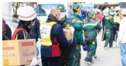
緊急物資搬送訓練