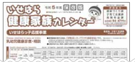
タブロイド判(273mm×406mm)、全4ページ