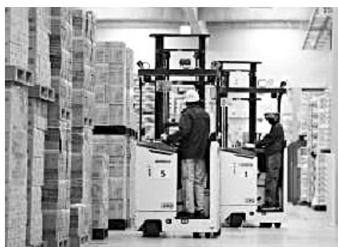
フォークリフトを使って商品を丁寧に積みます