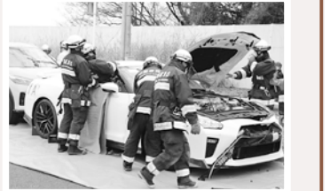
運転席のドアから傷病者を救出

高速度道路での多重事故を想定した合同訓練を実施しました 日産テクニカルセンター内で、市消防本部と秦野市消防本部、NEXCO日本伊勢原保全サービスセンターの合計約40人が車両規制や救出活動、車両解体といった一連の流れを確認しました。訓練にあたり、日産自動車から構内道路の使用や解体車両の提供といった協力があり、実践的な訓練ができました。(2月25日)