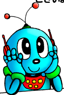
子ども科学館 イメージキャラクター「ピコ」