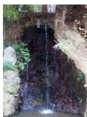
⑥～⑨参拝前に 身を清めた滝