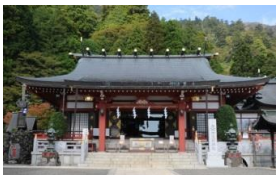
⑪阿夫利神社 (現・大山阿夫利神社・下社)