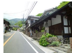
⑤参道沿いに建てられた 宿坊