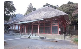
③霊山寺 (現:宝城坊. 通称:日向薬師)