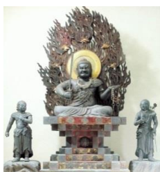
⑩鉄造不動明王 (大山寺)