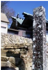
⑫阿夫利神社 (現・大山阿夫利神社・本社)