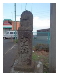
○道標 (市内に多く現存)