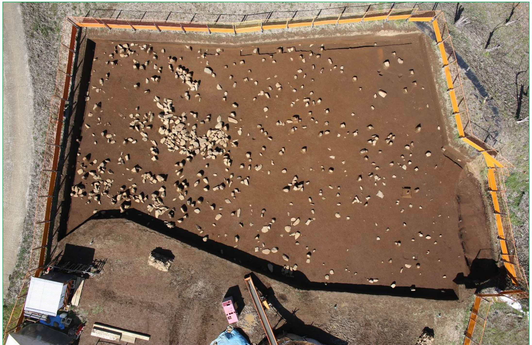
子易・大坪遺跡 10 区東 縄文時代後期中葉～末葉の配石遺構群