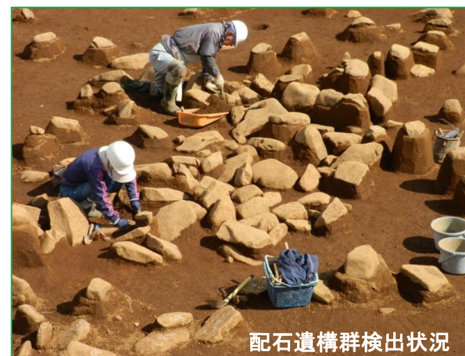
配石遺構群検出状況