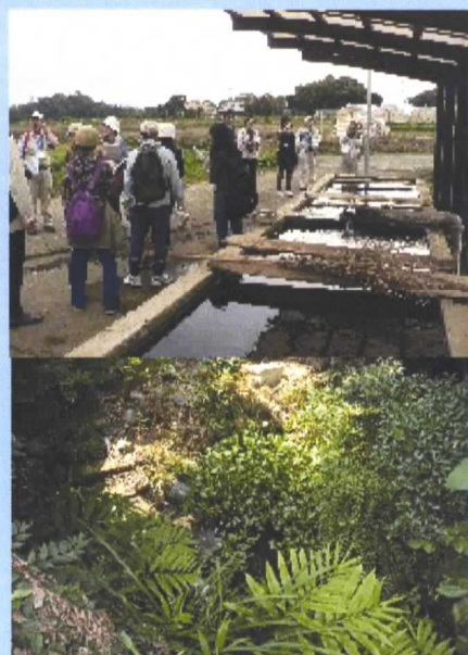
写真(上)野菜洗い場、(下)庭隅の湧水

感想の中にもありますが、この地区には川はありません。そのかわり、湧水が点在しており、中には、魚が泳いでいるもの、下に掲載している写真のように、庭の隅でひっそりと湧き出しているものもあります。しかも、そこは、絶えずきらきら光る水で満たされています。 また、成瀬地区のまち歩きの中でも紹介しました「水神様」が、平間地区内にもありました。地域の皆さんが、昔から「水」に対して特別な