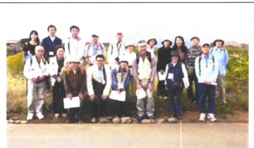
いせはら市景観まち歩き(大田地区) (H23.10.18)

◎歩き方によって景観は変わると思う。見る人の気持ちによっても大きく左右されると思う。