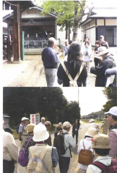
地域のむかしを聞く