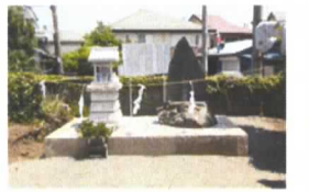
舟つなぎの松の近況 昨年訪れた時は、立て札がひっそりと立っているだけでしたが、云われを記した看板と立派な石碑が建立されていました。

◎子どもの頃から住んでいるので、今まで伊勢原の事は何でも知っていると聞いていた。まち歩きに参加して、今までは、知らないところがあることに気づかなかったから、そう言ったのだと改めて思う。 同じ切り通しでも、地域によってその感じはさまざま。やはりその場に行ってみないとわからない。