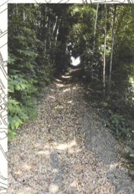
やかんころばし坂