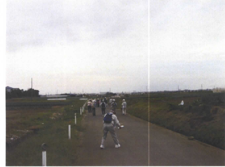
地区の特徴である広い空のもと田園風景を堪能