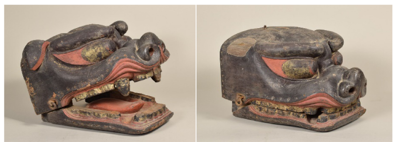
今年度修理を予定している国指定重要文化財宝城坊の木造獅子頭

この計画に基づき、文化財所有者や市民団体、関連組織等の協力のもと、本市の多様な文化財について、保存と活用の取組を推進していきます。