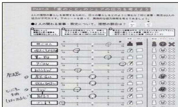
実際に記入してもらったシート