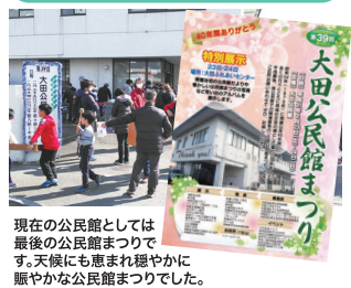
現在の公民館としては最後の公民館まつりです。天候にも恵まれ穏やかに賑やかな公民館まつりでした。