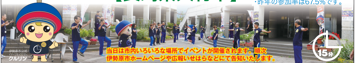
当日は市内いろいろな場所でイベントが開催されます。順次伊勢原市ホームページや広報いせはらなどに告知いたします。