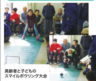
高齢者と子どものスマイルボウリング大会