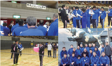
ワンバウンド・ふらば〜る・バレーボールを研修しました。