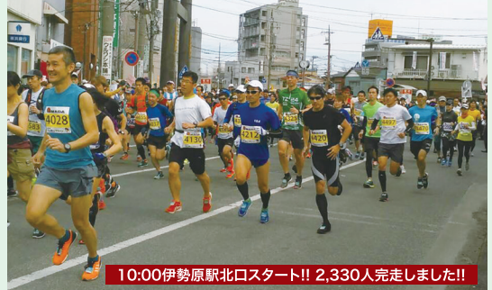
10:00伊勢原駅北口スタート!! 2,330人完走しました!!