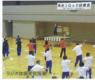
ラジオ体操実技指導