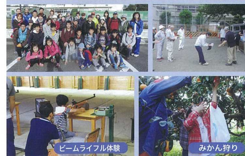
ビームライフル体験