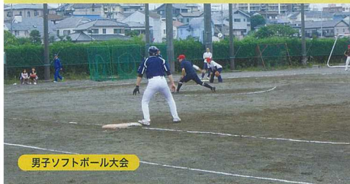
男子ソフトボール大会