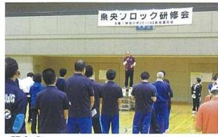
開会式 バウンスポール