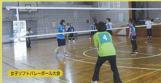
女子ソフトバレーボール大会

伊勢原北地区では10月の体育祭をメインに、ベタンク大会、男子ソフトボール大会、女子ソフトバレーボール大会、男女混合ソフトバレーボール大会などを行っています。特にベタンク大会は年配者も気軽に出来るスポーツなので人気があり、毎回大勢の方々の参加があり、とても盛り上がります。これからもスポーツを通して地域住民の皆様の体力向上に貢献していきたいと思っています。