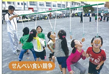
せんべい食い競争