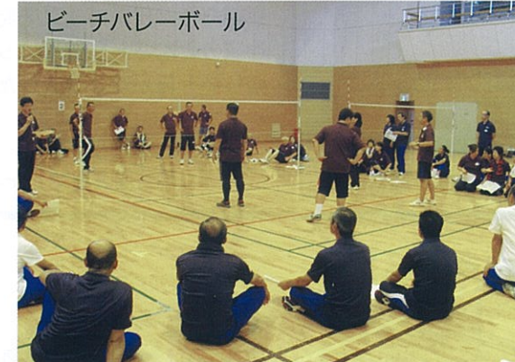
ビーチバレーボール