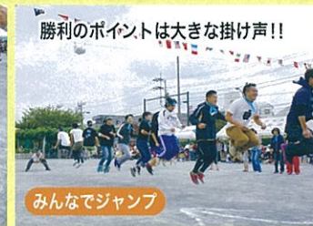
みんなでジャンプ