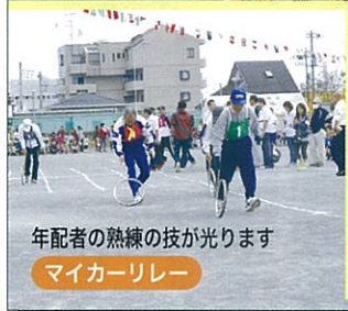
年配者の熟練の技が光ります マイカーリレー