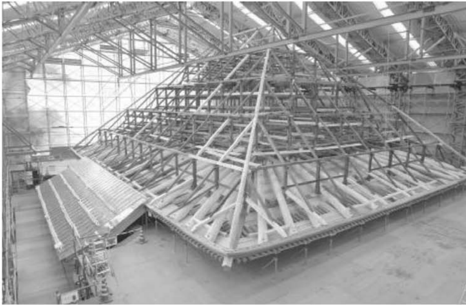
小屋組が組み上がった日向薬師宝城坊本堂