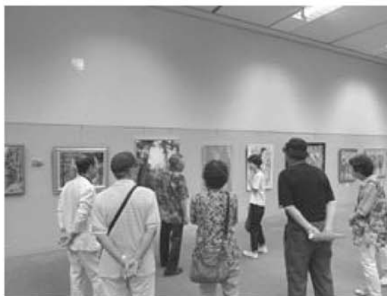
いせはら市展の様子