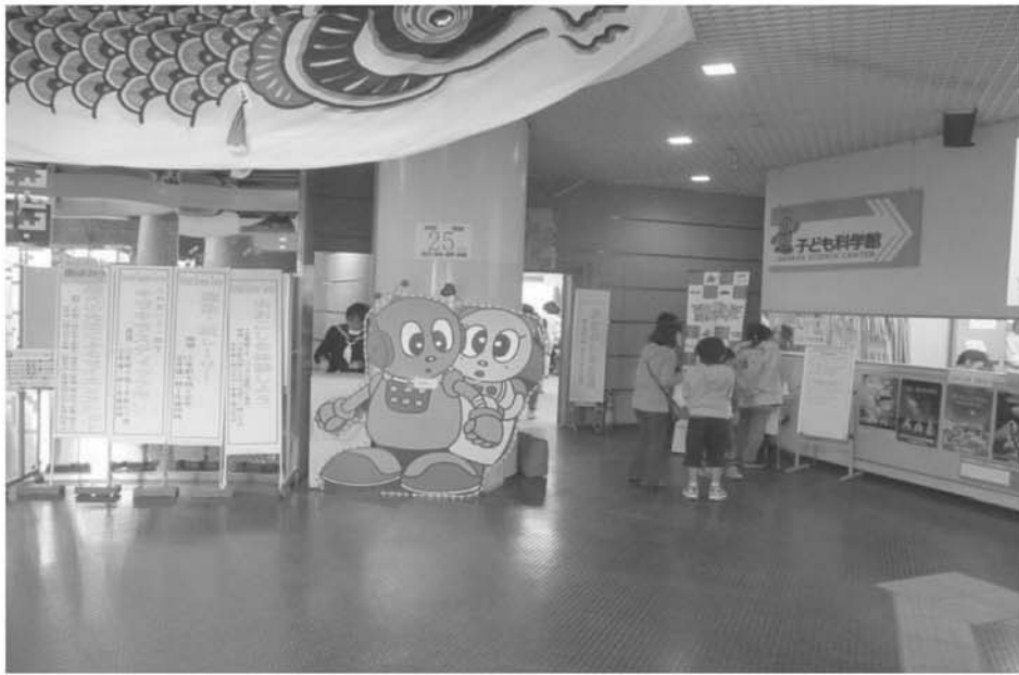
子ども科学館 (ピコ・ピピ)