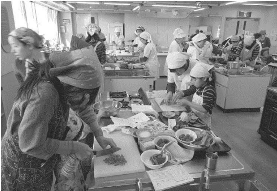
親子でつくるホームパーティー料理講座