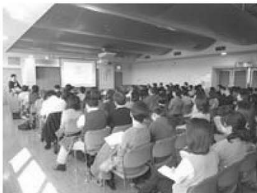
公開講演会の様子

物質的豊かさから、さらに精神的豊かさが求められるようになってきている中、市民自らが創造する文化活動への参加と関心を深めるため、市文化団体連盟が組織されており、創作発表・鑑賞の場を提供するとともに、各団体の自主的活動を通じて、芸術文化の向上・発展に努めている。 市民文化祭や姉妹都市茅野市文化交流展の協働実施を通じて、市内の各文化団体との連絡・調整、情報・資料の交換、研修会や交流会の開催などを促すとともに、いせはら市展をはじめとした市内の文化芸術事業の連携推進を図った。