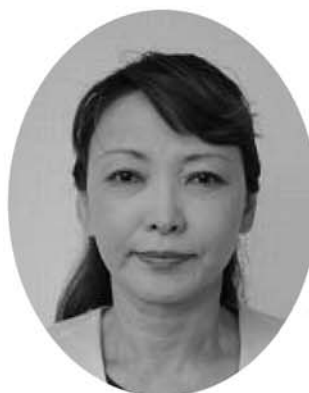
重田委員（教育長職務代理者）