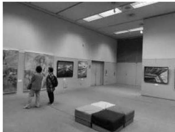
いせはら市展の様子