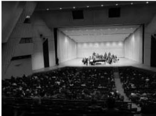
市民音楽会の様子

市民文化祭や姉妹都市茅野市文化交流展の協働実施を通じて、市内の各文化団体との連絡・調整、情報・資料の交換、研修会や交流会の開催などを促すとともに、いせはら市展をはじめとした市内の文化芸術事業の連携推進を図った。