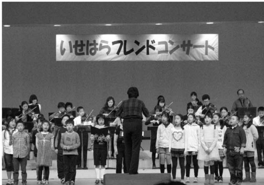
いせはらフレンドコンサート