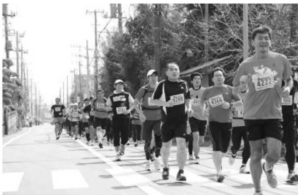
大山登山マラソン大会