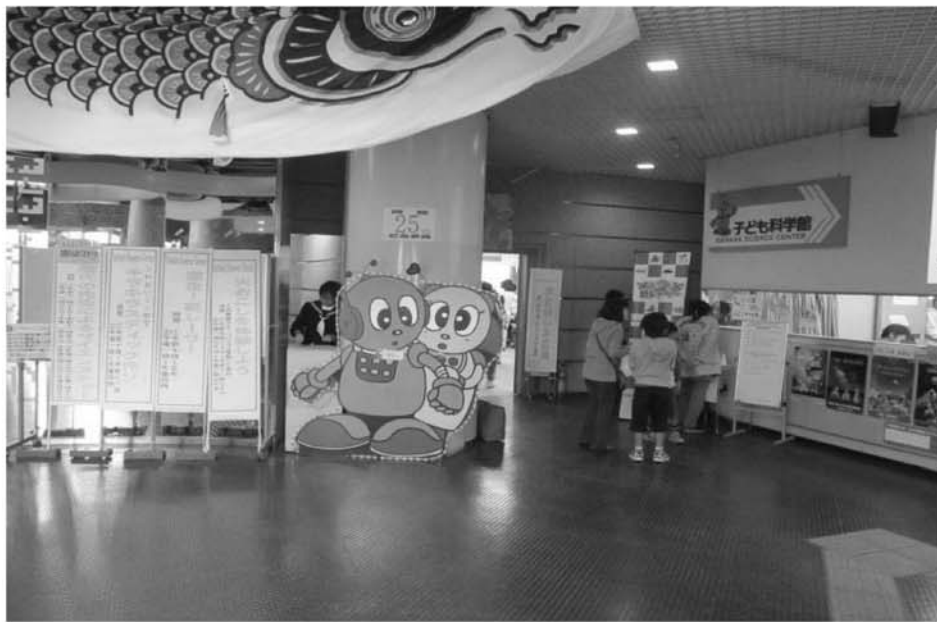
子ども科学館（ピコ・ピピ）