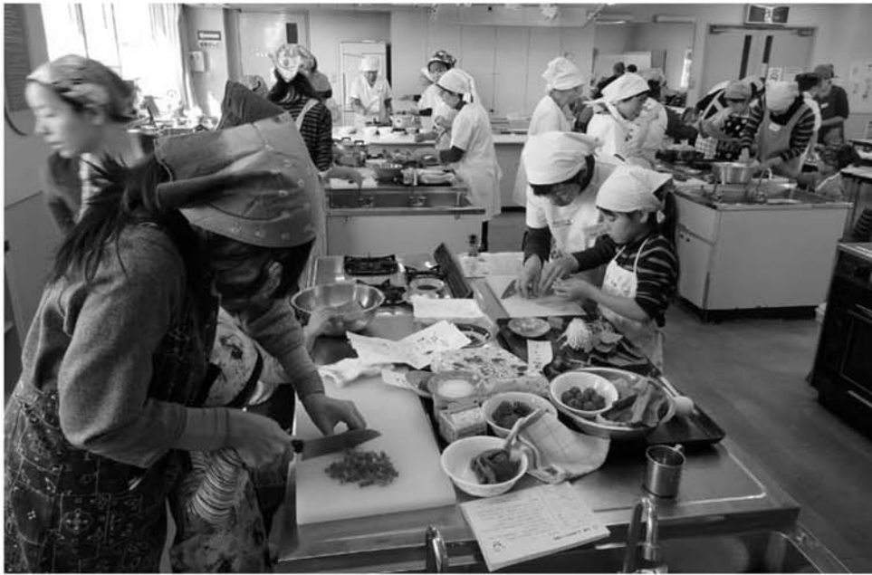
親子でつくるホームパーティー料理講座