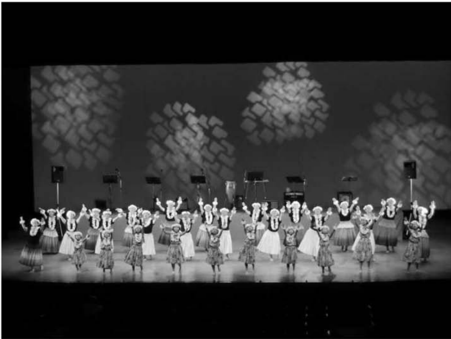
伊勢原市民文化祭