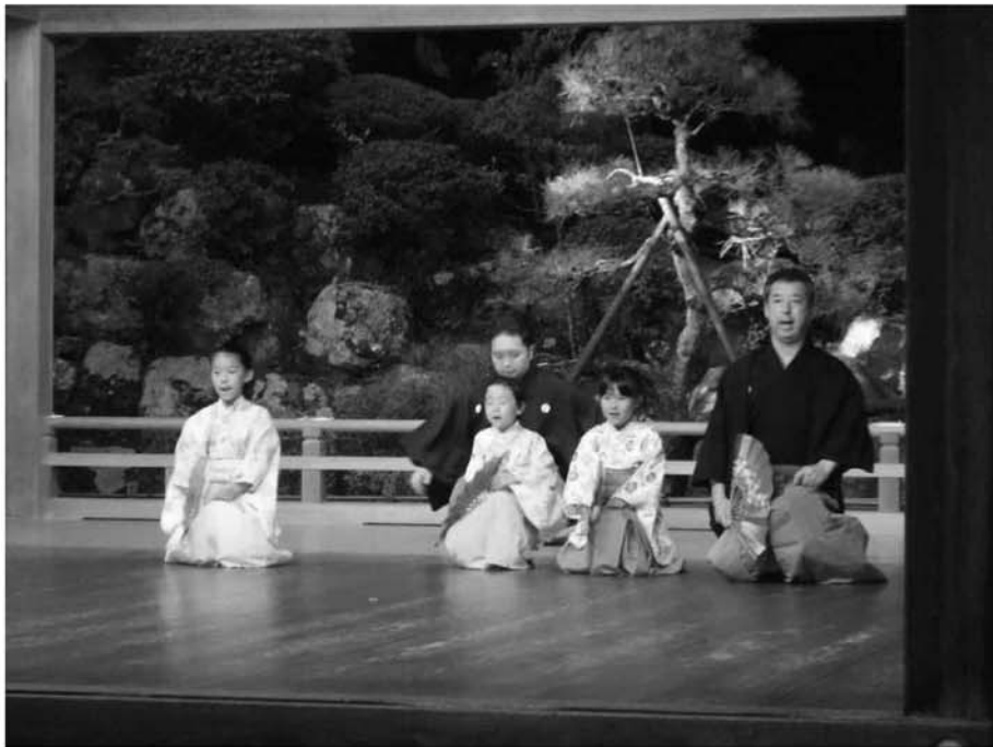
伝統文化大山能狂言親子教室