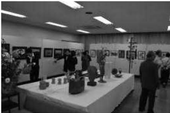
姉妹都市文化交流展の様子

市民文化祭や姉妹都市茅野市文化交流展の協働実施を通じて、市内の各文化団体との連絡・調整、情報・資料の交換、研修会や交流会の開催などを促すとともに、いせはら市展をはじめとした市内の文化芸術事業の連携推進を図った。