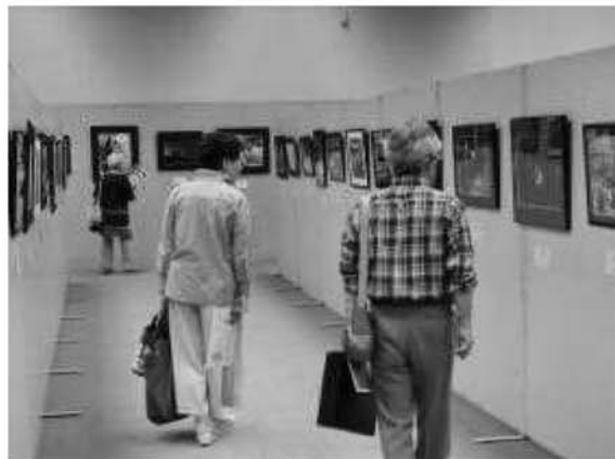
いせはら市展の様子