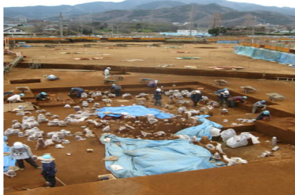
(写真) 発掘調査現場の公開