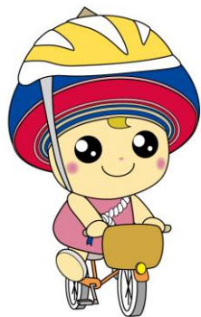
伊勢原市公式イメージキャラクター クルリン