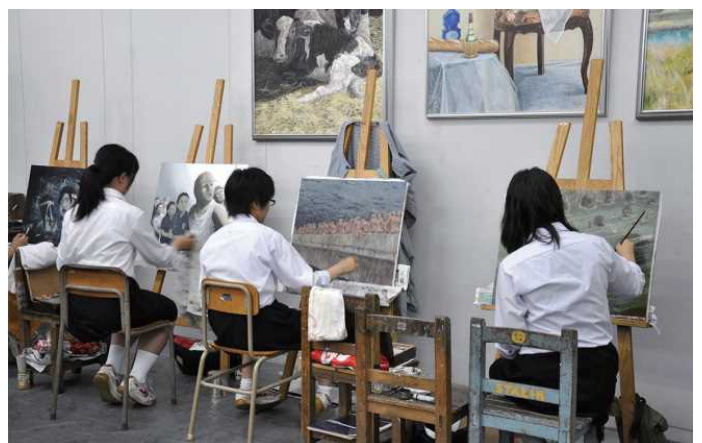
「原爆の絵」の制作に取り組む高校生