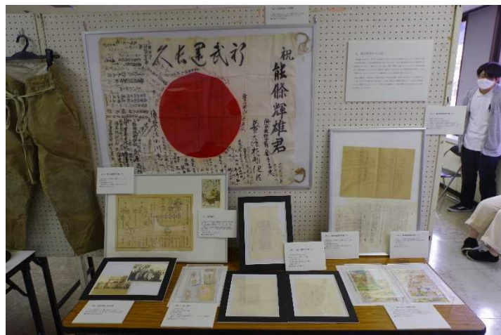
令和4年度「平和を祈念するパネル展示」の様子