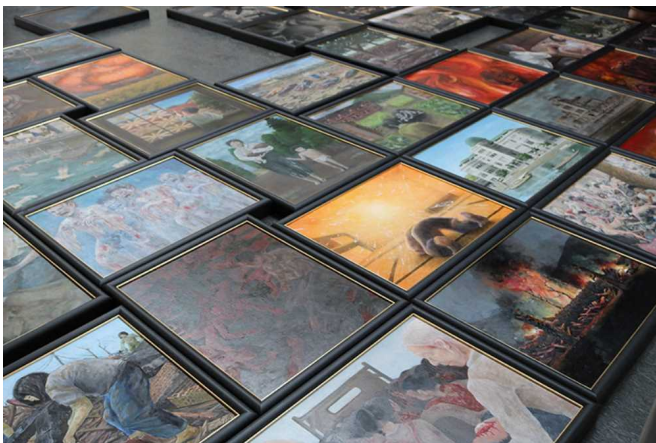
制作された「原爆の絵」

この取り組みは、被爆者が高齢化するなか、被爆の実相を絵画として後世に残すことや、絵の制作を通して、高校生が被爆者の思いを受け継ぎ、平和の尊さについて考えることを目的に行われています。