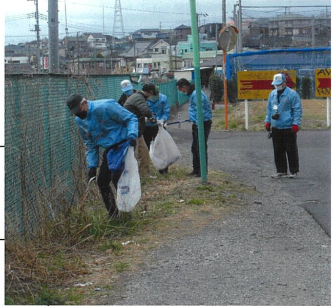
▲ポイ捨て防止パトロール ▼防犯パトロール

5月 7日(土) 八幡神社との懇親会(会長対応) 15日(日) 民生児童委員との懇親会 22日(日) 防犯パトロール 25日(水) 南地区自治会長会議(会長対応) 28日(土) 集会所建設委員会 5月度定例役員会