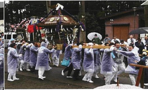
神輿を背に、宮出し