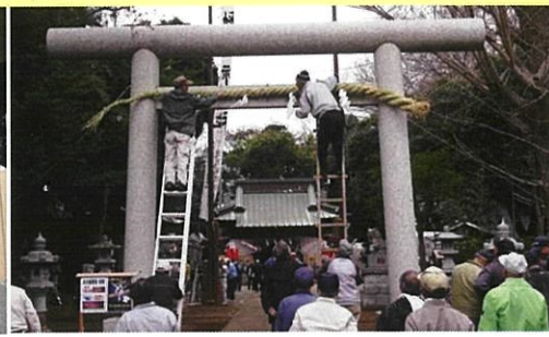
祭の準備(前日から神社総代、自治会役員、青年団など多くの方々が準備します)