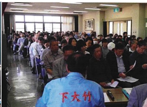
参加された新旧の組長さん