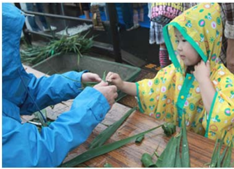
懐かしい笹舟作り