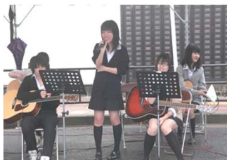
伊志田高校・ビッグマウンテン、バンド演奏