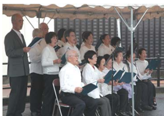
長寿の元、元気な歌声 石田長寿会合唱