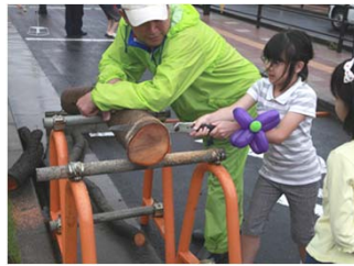
恒例丸太切り体験