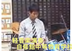
軽音楽演奏 自修館中等教育学校