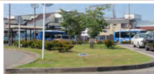
安全安心ステーション前歩道