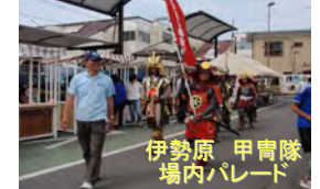
伊勢原 甲冑隊 場内パレード