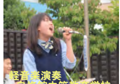
軽音楽演奏 自修館中等教育学校