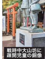
戦時中大山坊に疎開児童の銅像

大山阿夫利神社下社登山口付近の疎開時の銅像終戦まで川崎の児童達が大山講の宿坊に疎開記念