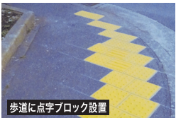
歩道に点字ブロック設置

皆さんの力で、酷暑の中 愛甲石田駅前、各公園の草むしり、花や植栽がきれいになりました。 活性化委員会ラジオ体操班