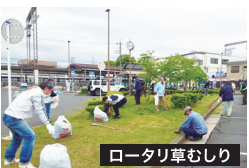
ロータリー草むしり