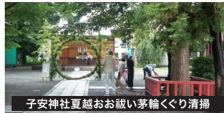
子安神社夏越お祓い茅輪くくり清掃

令和4年4月10日(土)子安神社例大祭。残念ながら、子ども神輿は中止になりました。子安神社夏越お祓いの茅の輪設置。半年の穢れや汚れ取り払う神事。