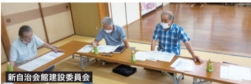
新自治会館建設委員会

令和6年に100周年を祝う記念行事を迎える。石田自治会では、そのスケジュールに合わせて新自治会館建設を進めています。皆さんにとって使い易い新会館になります。