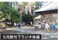
5月節句下ラジオ体操

皆さんの力で、酷暑の中 愛甲石田駅前、各公園の草むしり、花や植栽がきれいになりました。 活性化委員会ラジオ体操班