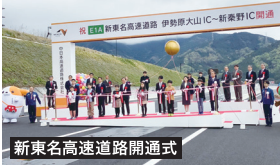
新東名高速道路開通式