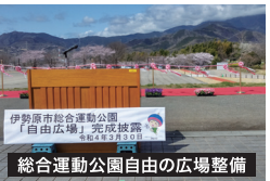
総合運動公園自由の広場整備