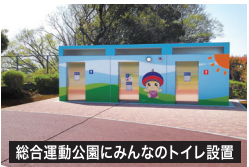
総合運動公園にみんなのトイレ設置