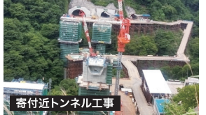
寄付近トンネル工事

令和4年4月16日(土)に開通しました第二東名も秦野インターから新御殿場までの工事が進められています。松田町付近の山々のトンネル工事が軟弱地盤の為遅れる模様です。完成すれば市民の皆さんにとって大変便利になります。