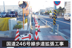
国道246号線歩道拡張工事

令和3年11月、視覚障害者用の点字ブロックを成瀬コミュニティセンターから駅までの歩道に一人で歩けるように設置。