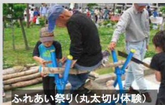
ふれあい祭り(丸太切り体験)