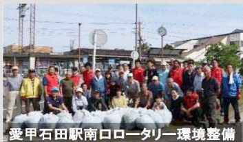
愛甲石田駅南口ロータリー環境整備

(神奈川県・伊勢原市) 駅前ロータリーから広がるふれあいの輪 ～地域でできることは地域で～