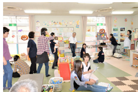
お父さんお母さんの骨量測定会