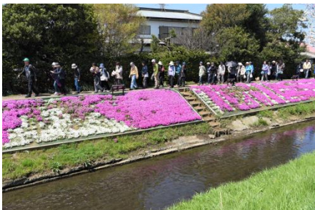
ゆったりウォーキング