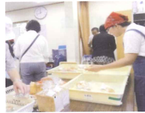
竹の子学園のパン販売

南地区は、小田原にある障害者支援施設「竹の子学園」を視察しました。到着後、施設長の方から学園の特色について説明を受け、利用者の生活介護や自立訓練（パン製造販売）に日々支援を行っているとの話に支援という言葉の重みを改めて感じました。