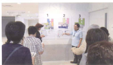
七沢自立支援ホーム

毎月1回の連絡会で情報交換や研修・ふたごちゃんすぺしゃるデイの協力等を行い、本年は神奈川県総合リハビリテーション七沢療育園・七沢学園の見学研修を行いました。