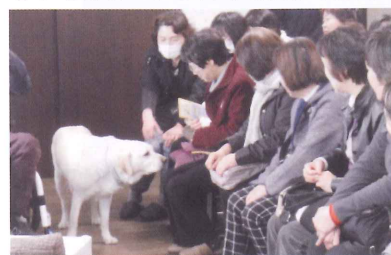
公益財団法人日本補助犬協会

成瀬地区は、33人の委員にて活動しています。毎年、いろいろな場所への研修を試みており、今年は春に横浜にある日本補助犬協会を訪れました。補助犬についての知識を改めて学び、障害のある方への配慮を考えさせられた大変充実した1日でした。