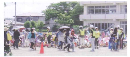
災害時児童引渡し訓練

大田地区では自治会と民生委員児童委員がともに協力して、地域の安全安心のために児童の登校下校時の見守りパトロールや夜間パトロール、ひとり暮らし高齢者等の見守りを実施しています。また小学校と中学校との情報交換を行い、地域活動に積極的に参加するなどして、民生委員児童委員としての大切な活動をしています。災害時において民生委員児童委員としての役割について意識の高揚を図っています。