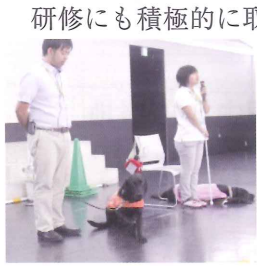
盲導犬訓練センター 富士ハーネスにて

北地区は、駅前にあるコミュニティ広場くるりんを介してボランティア活動をしています。