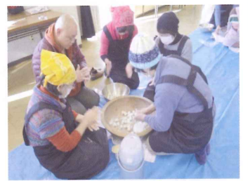
同じ大きさの団子になるかな？

当日は園児と一緒に団子を枝に飾ります。楽しい思い出の1ページとして健やかな成長の一助となることを願っています。