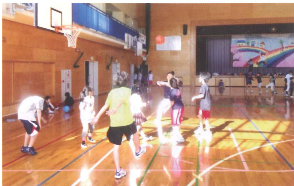
元気に遊ぶ子どもたち