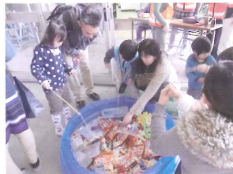
なにがつかれるかな…

私たちは、ビニールプールにたくさんのおもちゃ？を入れ、格安で釣りを楽しんでもらっています。続けて何回もやってしまう子もいて、「ムダづかいをしちゃダメよ！」なんて言ってしまいます。