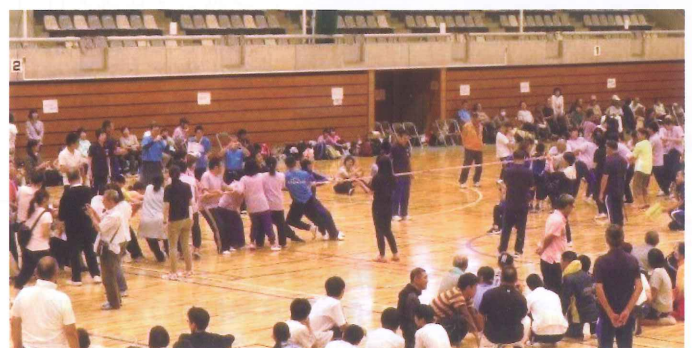
障がい者スポーツ大会