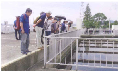
伊勢原市アクアクリーンセンター

昨年委員改選があり、成瀬地区は11人が入れ替わり現在は32名で活動しています。各地区共通の事業及び独自の啓発・研修会を実施しています。