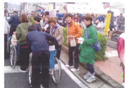
道灌まつりでの啓発事業