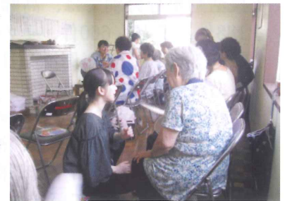
東海大生の楽しい音楽療法

昨年9月に比々多地区三ノ宮にミニサロンが開所、この施設では空き家の所有者等の方々のご尽力により、月に1回近隣の方30人ほどが集い、ボランティアによる催しやゲームなど楽しいひと時を過ごしています。その際は、地域の民生委員とともに地区の他の委員もサポート役として交替で参加しています。