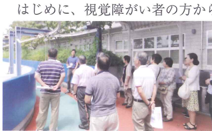
安心して利用できるジョギングコースの器具

相談される方の立場で福祉的支援ができるよう研修を重ね、活動しています。今回、神奈川県ライトセンターを見学しました。