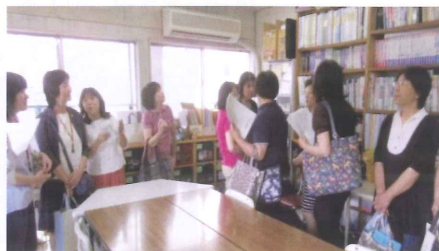
大原児童館内「適応指導教室」