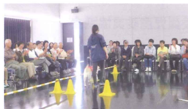
盲導犬の実技・訓練を見学

富士宮市日本盲導犬総合センター富士ハーネスを訪問視察しました。盲導犬の主な役割には①曲がり角を教える②障がい物を教える③段差を教えるといった3つの仕事があり、盲導犬と出会った時に守るべきことは、ハーネスを装着した盲導犬は仕事であるので、話しかけたり、目をじっと見つめたり、触ってはいけない等の説明を受けました。説明後、施設全体を視察し研修を受けました。