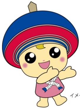
伊勢原市公式 イメージキャラクター クルリン

まずは、各家庭においてどのような「家事・育児」があるのか“棚卸し”することが重要です。