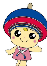
伊勢原市公式イメージキャラクター クルリン