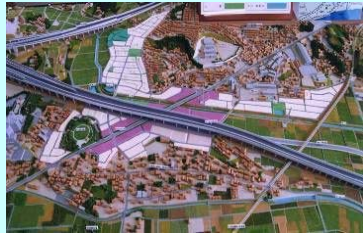
土地区画整理事業で整備された区画道路及び宅地