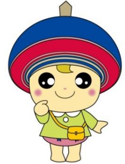
伊勢原市公式イメージキャラクター クルリン