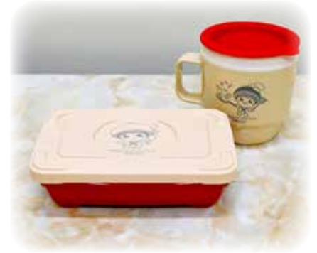
主食用弁当箱と保温汁容器