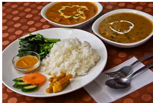
こちらは一例。当日はスペシャルディナーです