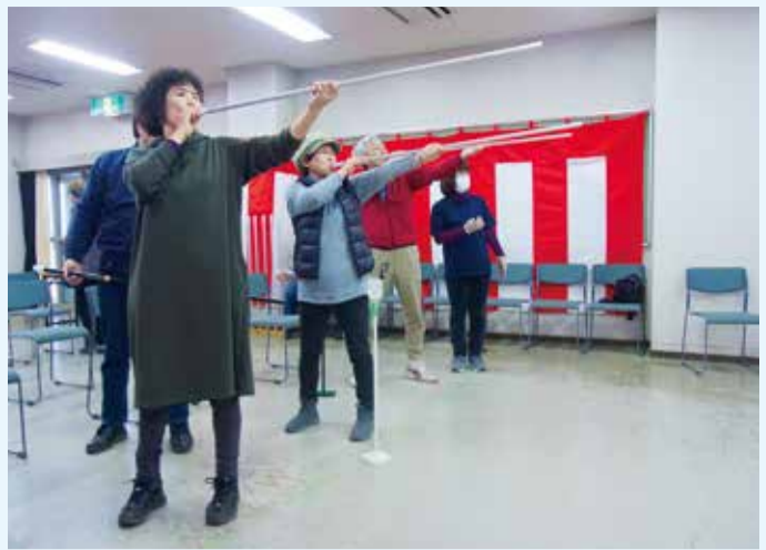
伊勢原南公民館で行われた体験会の様子