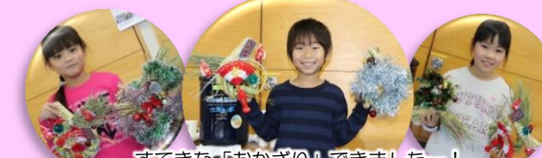
すてきな「おかげり」できましたー！

その後恒例の「お楽しみ汁」を食べ、心も体も温まりました。参加者に好評で、完食となって調理した方も喜んでいました。最後に参加者、スタッフに心より感謝いたします。