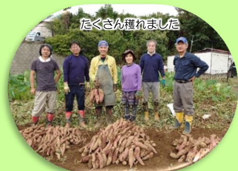
たくさん穫れました