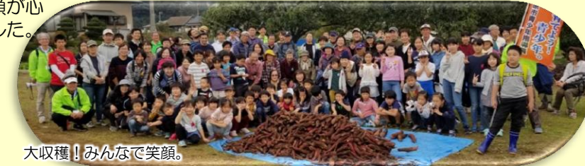
大収穫！みんなで笑顔。