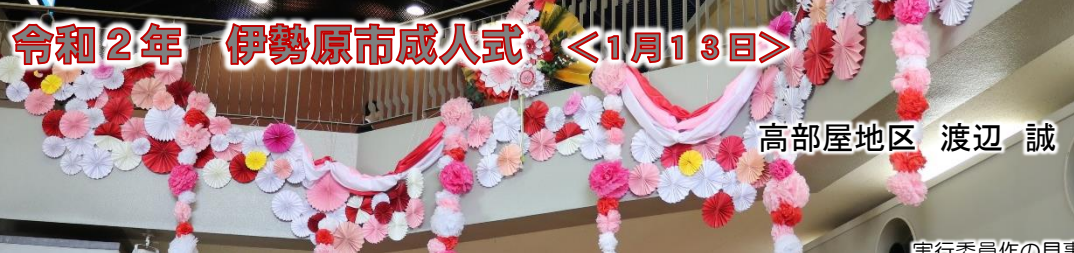
実行委員会の見事な装飾

令和最初の成人式は曇一つない空の下、市民文化会館にて778人が出席して開催されました。青少年指導員は今回も市職員、各団体の方々との協力し、受付、駐車場整理、会場案内等のお手伝いをいたしました。