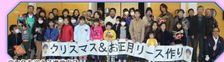
良い年を迎える準備完了