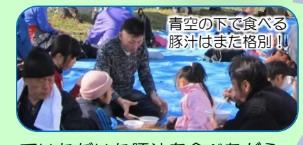
青空の下で食べる豚汁はまた格別！！

その後、みんなでお母さん方に作っていただいた豚汁を食べながら、雑談で盛り上がりました。元気な子は、工作教室のバルーンアートで楽しみました。一般の方で他の地域から小さな子どもを連れた親子が目につく大会でした。今回もご協力いただいた関係者、ボランティアの方々へ厚く感謝申し上げます。