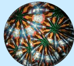
ゴージャス！美しい世界

ゴージャスな万華鏡は円筒状の容器にミラーと色とりどりのカラーセロハンを入れ作ります。完成後には美しい世界が見れるものです。