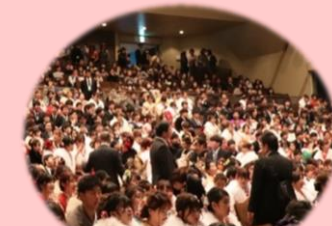
速やかに会場内を誘導