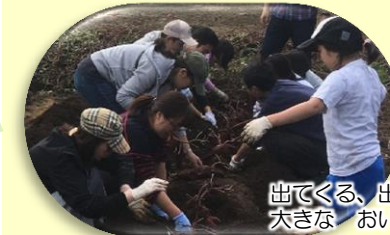
出てくる、出てくる！ 大きなおいもです。

最初の目的地の子ども科学館では館内を自由見学し、科学の不思議や楽しさに触れ合いました。何か新しい興味関心のあるものは見つかったでしょうか？