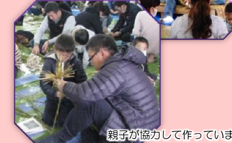
親子が協力して作っています