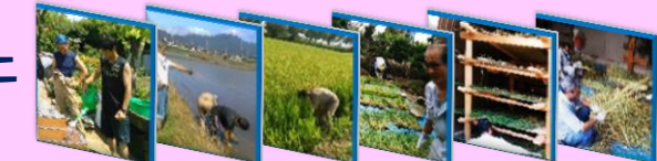
種まき → 田植え → 稲刈り → 日干し → 陰干し → 藁スグリ

まず藁を水で濡らし木づちで叩いて柔らかくし、専用工具に根本を二つに分けて固定します。双方の藁を右に捻じりながら左に編みます。今年は、クリスマス用と正月用のリースを2セット編み上げました。3人1組で友達や家族、指導員の協力で編み上げました。飾り付けをして、世界に一つのリースが出来ると、子どもたちは大満足でした。