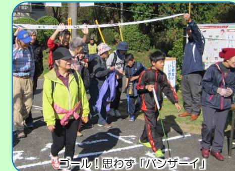
ゴール！思わず「バンザイ」

ここから左側が崖でスリルある山道を通って栗原方面へ抜けCP3の栗原自治会館にて休憩、色づいたミカン畑を見ながらゴールに向け約7kmのコースを92人全員が、山の空気を全身に浴びながら笑顔でゴールイン。