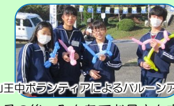
山王中ボランティアによるバルーンアート