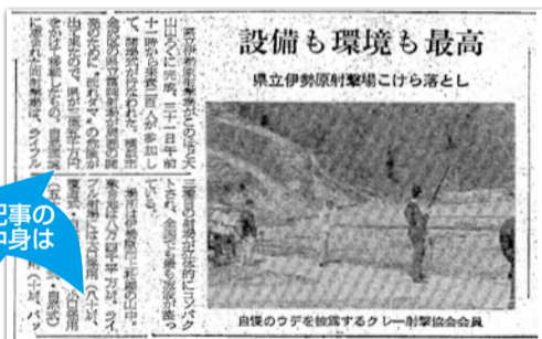
※当時の紙面記事をそのまま使用(一部記事省略)