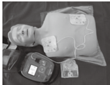
②電極パットを胸に貼る(位置は電極パットに記載されています)