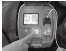
③電気ショックが必要と判断されるとボタンが点滅するのでボタンを押す