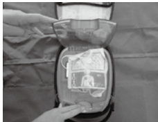
①ふたを開けて電源を入れる。電源ボタンを押すタイプもあります

日本では1日に約200人が心室細動という不整脈によって、突然命を失っています。救命には迅速な電気ショックが欠かせません。AED(自動体外式除細動器)が開発されたことにより、医療従事者以外の人でも命を救うことができるようになりました。現場で頼れるのは皆さんです。AEDの使い方を今一度確認し、大切な命を守りましょう。 平成16年7月1日にAEDの使用が一般市民にも認められたことから、7月1日を「AEDの日」として、全国的な市民運動が行われています。市では7月1日～10日を「AED普及啓発期間」とし、講習会や公共施設のAED点検、使用可能登録施設の設置状況確認を実施しています。 AEDの使い方 ※電源を入れると音声ガイダンスが流れます