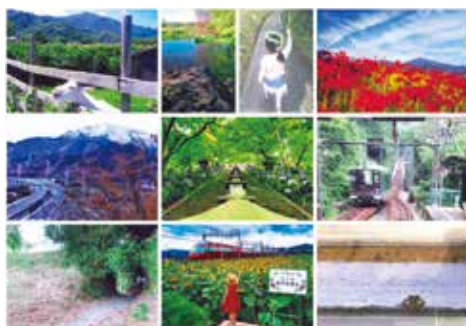
令和2年度を受賞作品：市長賞、教育長賞、観光協会会長賞、審査委員特別賞

本市の多様な景観資源を市民相互で共有し、市内外に発信する写真展です。あなたの身の回りにお気に入りの景観を写真に収め、伊勢原のまちの魅力を伝えてみませんか。なお、写真展は市ホームページ上で開催します。