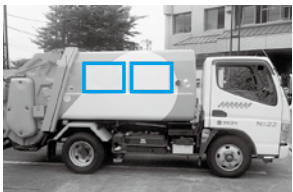
清掃車両の広告貼付位置

☎①管財契約検査課(市役所3階) ☎94-5020 ②環境美化センター ☎94-7502