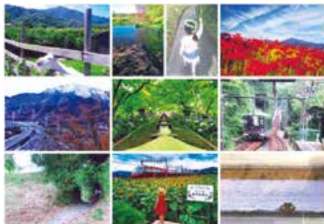
令和2年度を受賞作品：市長賞、教育長賞、観光協会会長賞、審査委員特別賞

本市の多様な景観資源を市民相互で共有し、市内外に発信する写真展です。あなたの身の回りにお気に入りの景観を写真に収め、伊勢原のまちの魅力を伝えてみませんか。なお、写真展は市ホームページ上で開催します。