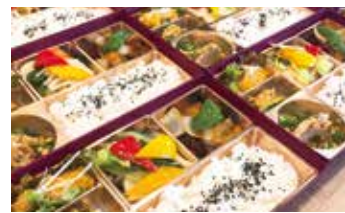
容器や盛り付けなど、各店ごとに工夫を凝らしたオリジナル弁当

こうした事態に対応し、伊勢原市商店会連合会では地元飲食店を応援するため、フェイスブックやインスタグラムなどのSNSを活用した「いせはらテイクアウト大作戦！」を開始。約40店舗が参加し、「お持ち帰りメニュー」の情報発信などを実施しました。