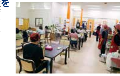
料金は大人300円、高校生以下100円で、営業時間は午後5時30分〜7時

伊勢原駅前にある「だいらくコミュニケーション広場 来るりん」を会場に、毎月第2・4水曜日に主食・副菜・デザートなど、栄養バランスが取れた温かい夕食を低額の料金で提供する「子ども食堂」が開かれています。運営するのは、子育てに一段落したベテラン主婦たち約20人。野菜や果物といった食材の多くは地域の人々からの寄付で賄われています。