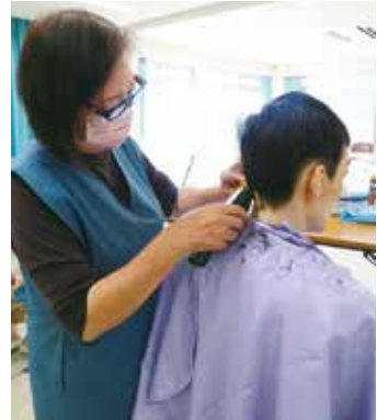
散髪は、月に1度行われています。一人の特性や、その日の体調などを丁寧に把握し、声のトーンや口調、表情に気を付けながら接する光景が見られました。

「様子、少し伸びてきたみたいだね。年末に向けて、すっきり切ってもらおうか。」車いすをゆくりと押しながら、優しく語りかける職員の声が聞こえてきます。11月上旬、栗蓬にある市内唯一の障がい者支援施設(入所のみどり園)では散髪が行われていました。