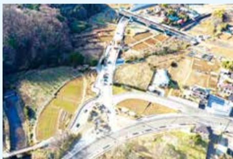
交差点新設箇所◇1月18日撮影

事業概要 道路区間 大山～三ノ宮地内 道路延長 3km 幅員 9.75m(今年度開通区間) 12.0m(供用済区間) 車線数 2車線