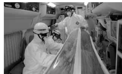
アイソレーター内の患者の容体を観察