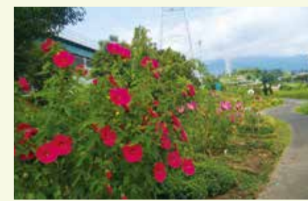
8月にはタイタンピカスが咲きます

作業は大変なことも多いですが、会員みんなが楽しみながら自分のペースで活動しています。「花は元気に咲いているかな」とつい気になってしまい、自然と足を運んでしまいますね。また、河川の歩道沿いにある公園なので、通りがかりの人