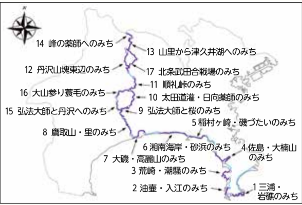
県内にある17のコース(参考 神奈川県ホームページ)

市内を歩くと「関東ふれあいの道」という看板を見かけます。気になったので、詳しく調べてみました。 この道は、環境省の長距離自然歩道構想に基づき、関東地方の都六県をぐるりと一周する歩道で、総延長は179.9km、八王子市の梅の木平が起終点となっています。多くの人が利用できるよう10km前後に区切った日帰りコースが160あります。 7つの国立・国定公園を通り、美しい自然や田園風景を楽しめるだけでなく、文化遺産