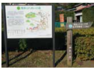
市内数箇所にある看板

産に触れ合うこともできます。各県ごとにコースが定められており、神奈川県では、三浦半島から湘南海岸を通り、大磯町から北上して丹沢山麓、峰の薬師(相模原市)を通って起点の東京都(八王子市)までを結び、延長197.2km、17のコースが設定されています。 歴史に触れながら歩いてみた 市内には3コースあり、そ