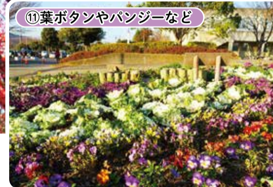
⑪葉ボタンやパンジーなど