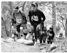
平成31(2019)年開催 第34回 大山登山マラソン大会

標高差650メートル、石段1610段、早春の大山路に1500人の健脚自慢が挑戦する登山マラソン。伊勢原駅北口をスタートし、大山街道旧道を通り、女坂をひたすら登り、大山阿夫利神社下社に至る片道9kmの過酷なコースです。