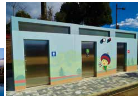
一般の部 市長賞「大山鏡」

オストメイトを完備したトイレを自由広場近くに新設しました。壁面は今年度のいせはら景観写真展の受賞作品「大山鏡」をヒントに装飾を施しました。内部の衛生器具は、センサーによる自動水栓や非接触式の手洗い場など、感染症対策にも対応しています。