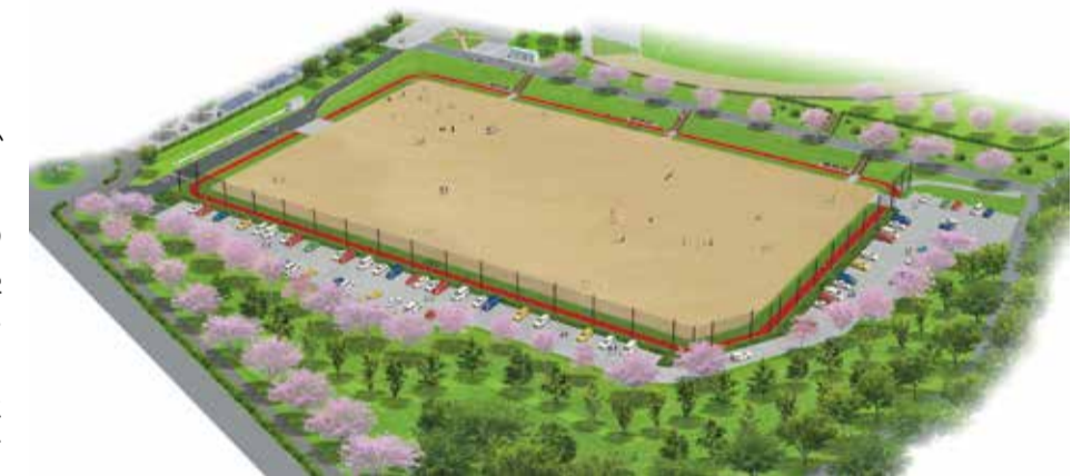
自由広場完成イメージ