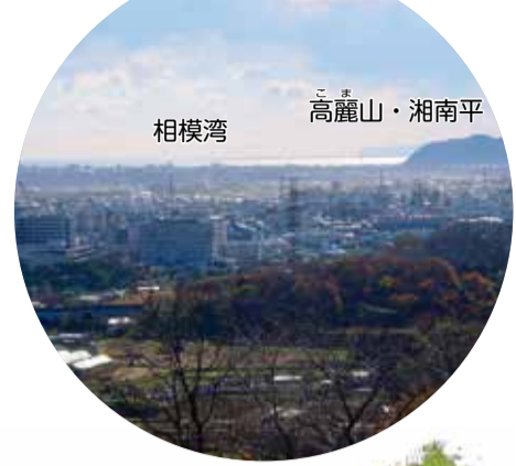
相模湾 高麗山・湘南平