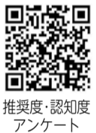
推奨度・認知度アンケート

伊勢原のオススメ度を教えてください(webアンケートにご協力) シティプロモーション活動を進める基礎資料とするため、「伊勢原を薦めたいか」という推奨度などを伺います◇回答方法＝市ホームページ「市へのご意見 webアンケート」から※右のQRコードからも回答できます 3月14日(月) 広報戦略課 ☎94-4864