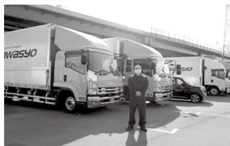
トラック28台とドライバー 36人の運行を管理