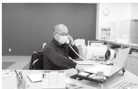
稼働車両はリアルタイムで場所が分かります