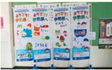
緑台小学校の児童が作成したのぼり旗

☎ねんりんピックかながわ2022伊勢原市実行委員会(スポーツ課内) ☎94-4628