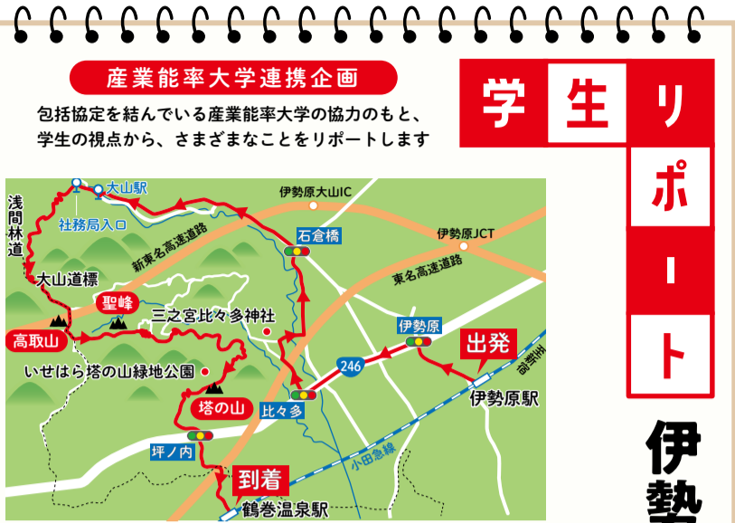
伊勢原駅を出発し、高取山に向かった今回の登山ルート

☎ねんりんピックかながわ2022伊勢原市実行委員会(スポーツ課内) ☎94-4628