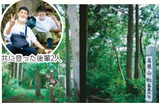
新緑が映える高取山の頂上

初めて聞いた名前だったが、記事がほとんど見つからなかった。大山しか登ったことのない私には、どのような山なのか見当もつかなかったため、大学の後輩2人を誘って