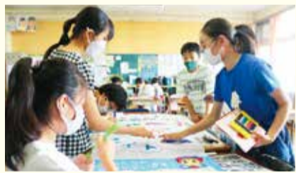
みんなで話し合い、デザインを考えました