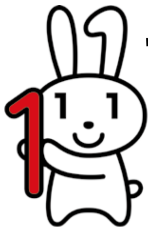
マイナンバーキャラクター マイナちゃん