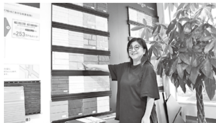
外壁と一口にいっても、さまざまな種類があります