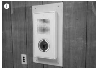
① 火災警報器の整備などに活用しました